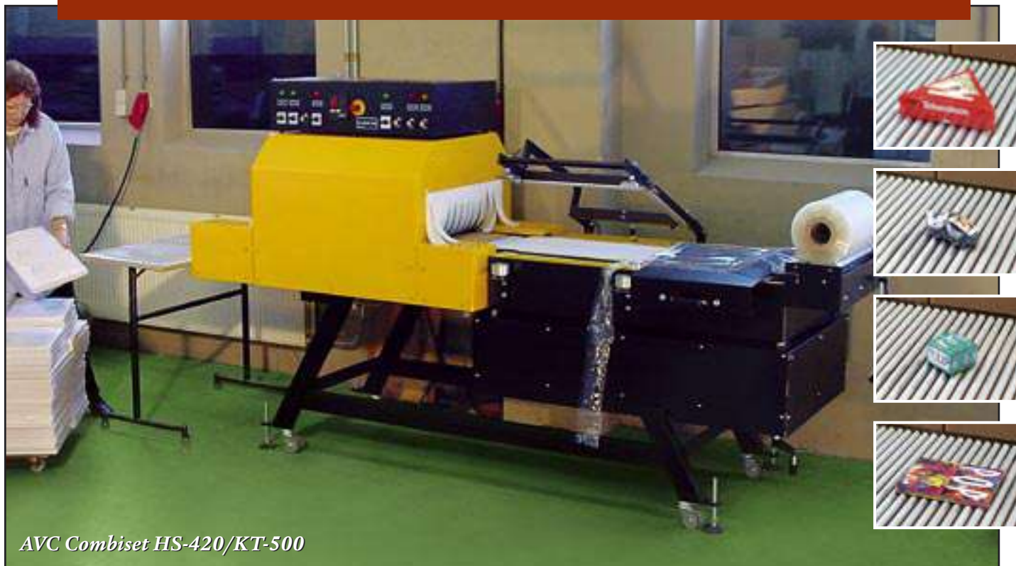
AVC Combiset HS-420/KT-500

Firma AVC Sealing Solutions jest dynamicznie rozwijającym się przedsiębiorstwem z długoletnim doświadczeniem i przejrzystymi ambicjami: chcemy być najlepsi w naszej branży. I możemy powiedzieć, że od dawna jesteśmy na dobrej drodze do tego celu. Dzięki pracom doświadczalno-rozwojowym stale rozbudowujemy i poszerzamy naszą wiedzę techniczną. W odniesieniu do naszych – a ostatecznie -Państwa - maszyn i urządzeń zdecydowanie chętniej używamy określenia „rozwiązanie techniczne” niż produkt.